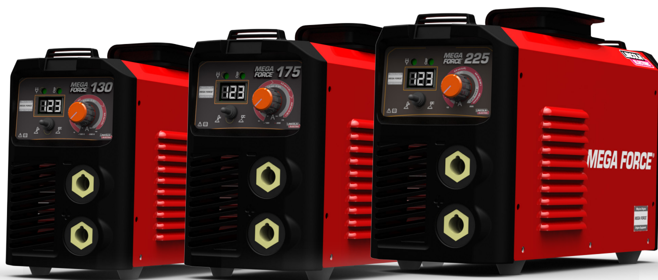
Mostrado: MEGA FORCE 225 – K69069-1